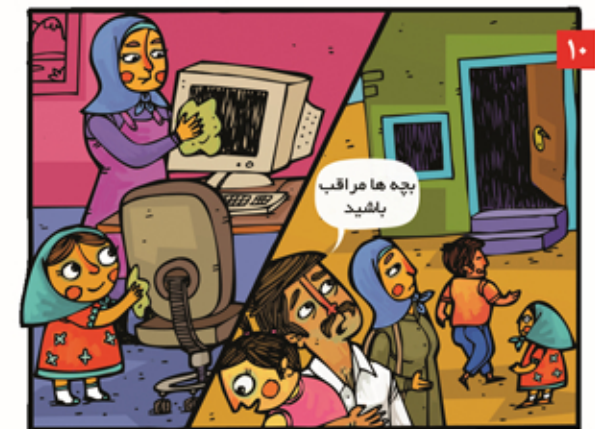
بعد از سیل وسایل خانه را تمیز کنیم تا از آلودگی گل و لای پاک شود. تا زمانی که مسئولین اعلام نکرده اند در نقاط امن بمانیم.