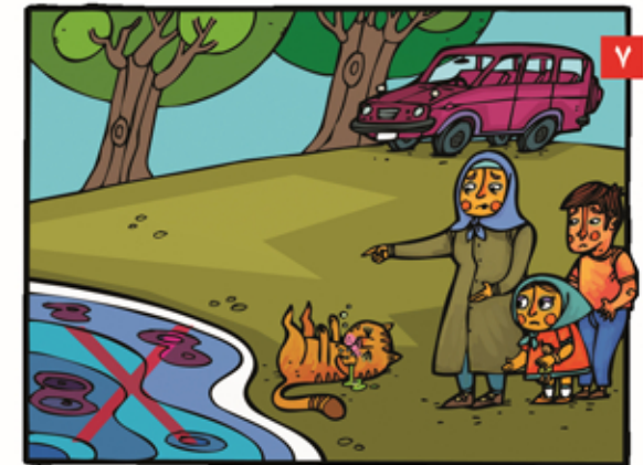
بعد از سیل از آب جاری ننشویم و به آن نزدیک نشویم، چون ممکن است آلوده باشد.