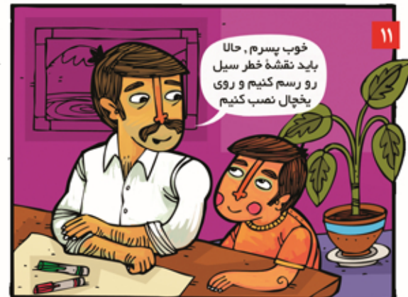
نقشه خطر سیل منطقه یا روستای خود را رسم کنیم. می توانیم از فضای خالی دور کاغذ برای نوشتن اطلاعات ضروری استفاده کنیم، مثل: محتویات کیف اضطراری، زمان مانور خانوار و غیره.