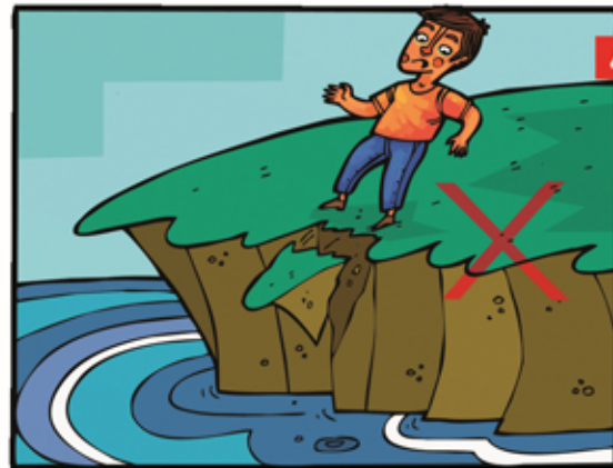
بعد از سیل در لب پرتگاه نایستیم چون ممکن است خاک آن سست شده باشد.